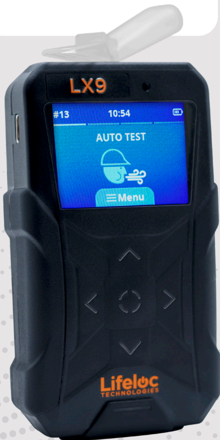
Not shown at actual size