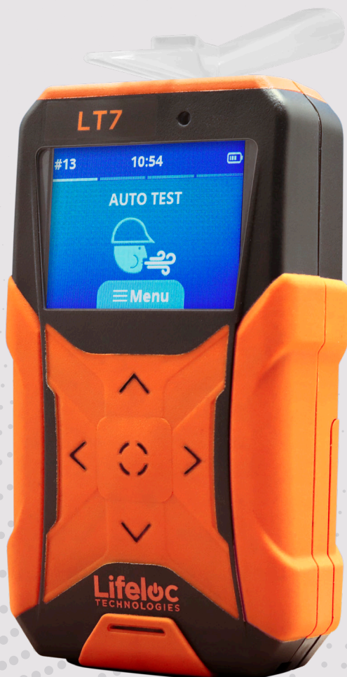
Not shown at actual size